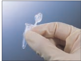
0.5 ml チューブ