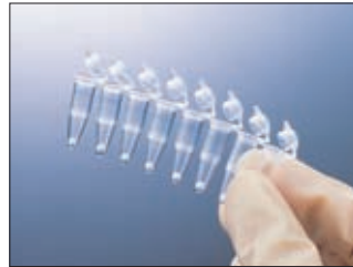
0.2 ml ヒンジ式チューブ (キャップつき)