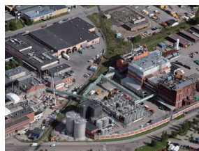
弊社アップサラ工場での製造キャパシティー拡大

市販もしくは承認済み医薬品の製造に使われているクロマトグラフィージェン、シングルユース製品、プロセス用フィルトレーション製品は、その医薬品の製造停止までは供給し続けます。